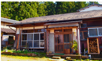
五泉ゲストハウス五ろり