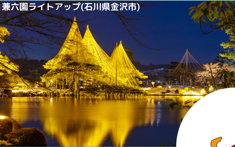
兼六園ライトアップ(石川県金沢市)