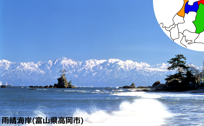
雨晴海岸(富山県高岡市)