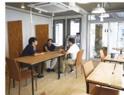
高田町家「こめつふ」 bibit（ビビット） furusatto ups（フルサット アップス）