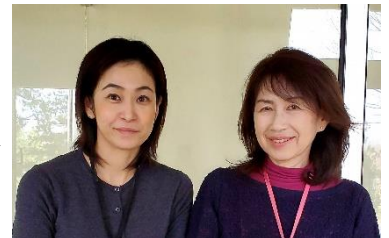
移住・定住コンシェルジュ（左） 雇用政策専門員（右）