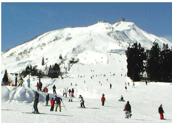
市内ゲレンデでのウィンタースポーツ