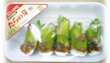
特産の山菜“たらの芽”