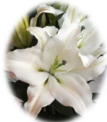
全国有数の生産量を誇るユリ