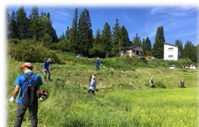
刈り払い機で余すところなく