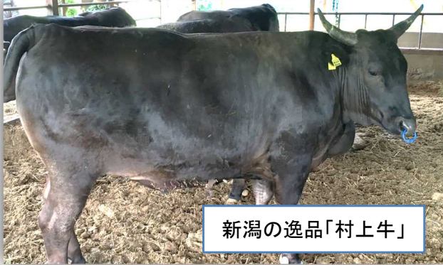
新潟の逸品「村上牛」