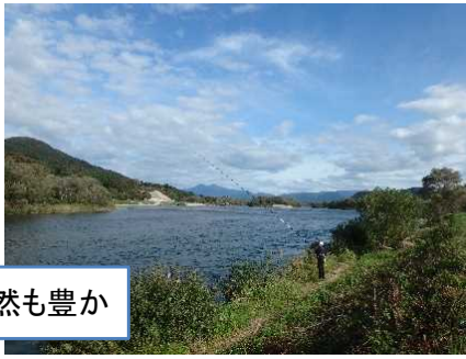
海や山など自然も豊か