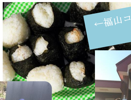
←福山コシヒカリの新米おむす び