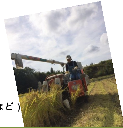
山の暮らしを体験しよう

【持ち物】作業着 (長袖), 長靴, 帽子, 手袋, 雨具, 上着, 着替え 健康保険証など