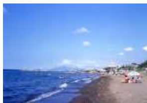
なおえつ海水浴場