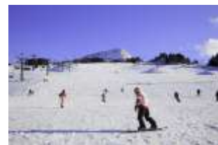
キューピットバレイスキー場

上杉謙信公のふるさと・上越市。平野部を山間部と海岸部が囲み、変化に富んだ地形と四季折々の美しい自然の中で、20万人の市民が日々の暮らしを営んでいます。