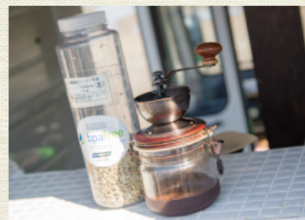
フェアトレードで仕入れた生のコーヒー豆を焙煎。