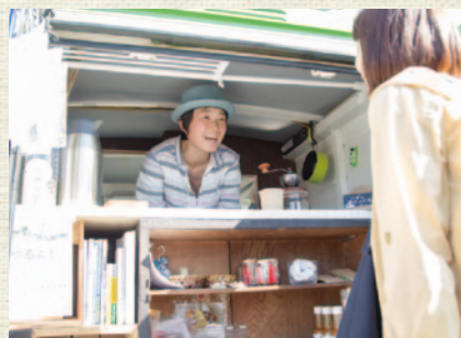
地元を中心に、すっかり顔なじみのお客さんも。

「主人の実家の畑が塩沢にあるので、野菜を作りながら、かたわらに移動販売車においてコーヒーを出して…なんて良いなあ。究極の夢は、自給自足の暮らしかな！」